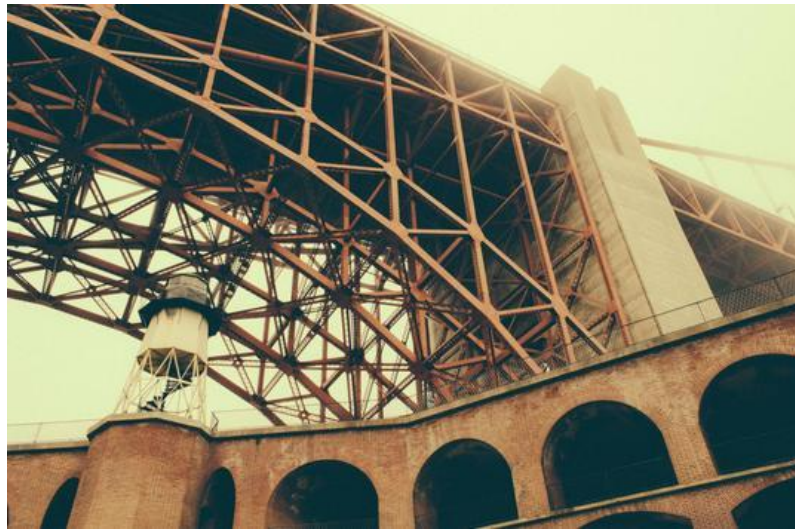
Slika 2.1: Še en primer slike

Lorem ipsum dolor sit amet, consectetur adipiscing elit, sed do eiusmod tempor incididunt ut labore et dolore magna aliqua. Ut enim ad minim veniam, quis nostrud exercitation ullamco laboris nisi ut aliquip ex ea commodo consequat. Duis aute irure dolor in reprehenderit in voluptate velit esse cillum dolore eu fugiat nulla pariatur. Excepteur sint occaecat cupidatat non proident, sunt in culpa qui officia deserunt mollit anim id est laborum [3].