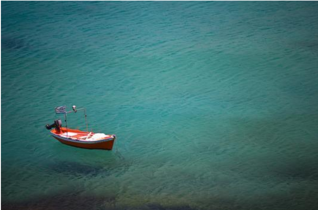
Slika 1.1: Primer slike

dolor in reprehenderit in voluptate velit esse cillum dolore eu fugiat nulla pariatur. Excepteur sint occaecat cupidatat non proident, sunt in culpa qui officia deserunt mollit anim id est laborum [2].